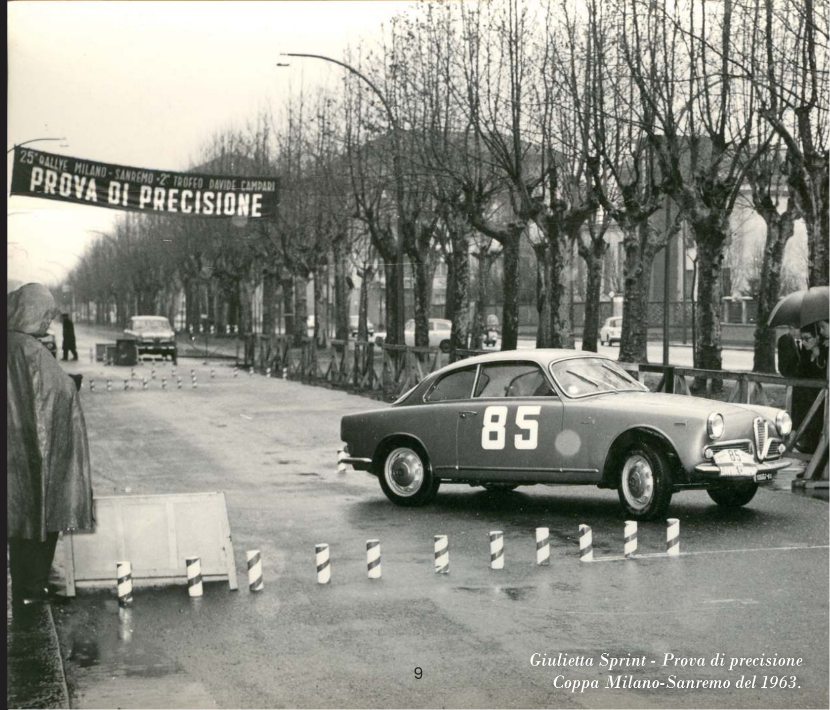
Giulietta Sprint - Prova di precisione Coppa Milano-Sanremo del 1963.